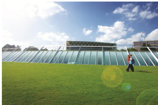
UNIVERSITY OF EAST ANGLIA