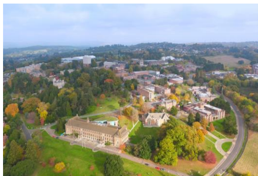
UNIVERSITY OF EXETER